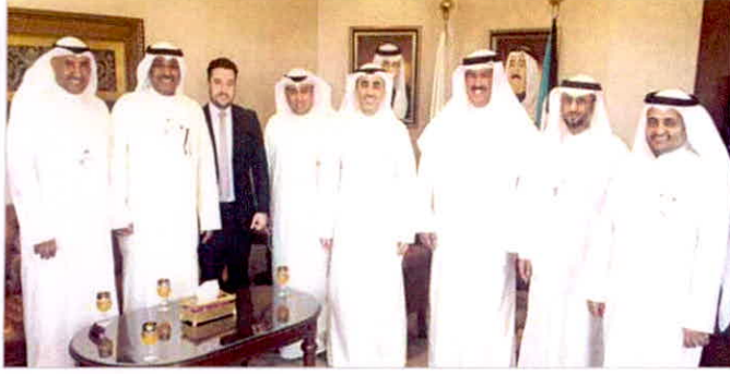
التوجيهي والمضف ومسؤولو الطرفين في لقطة جماعية